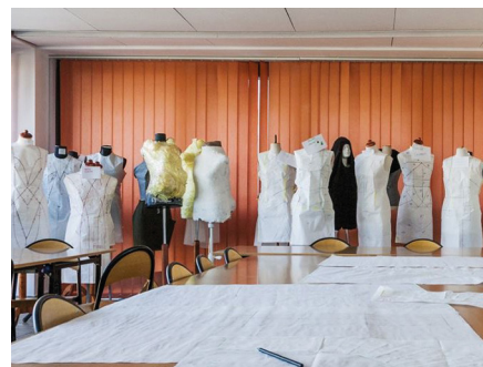
fot. 2